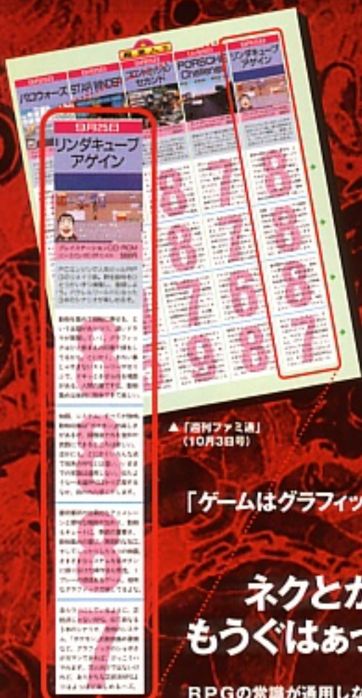
▲「週刊ファミ通」(10月3日号)

所々入るアニメーション (感動) には久々にドキッとさせられました。買ってよかったです。(女・21歳)