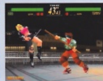
キャラクターの再現度も良好!

根本的なことですが、ラスプロでは武器を使用しているので素手同士の格闘ゲームに比べて処理が重くなりますから、当たり判定などの再現が難しいですね。