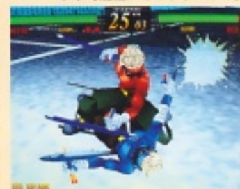
9人の個性豊かなキャラは、どれも人気高し!

正直いって考えていません。中途半端な設定のキャラを入れるとラスプロの世界観を崩してしまう可能性がありますからね。