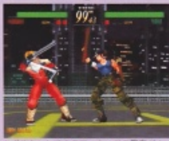
セガサターン版のアーケードの再演が!

キャラクターと背景の「ビジュアルの再現性」と「立体感の表現」の両立ですね。またアーケードからの移植ですからプレイ感覚の再現には力を入れていますね。