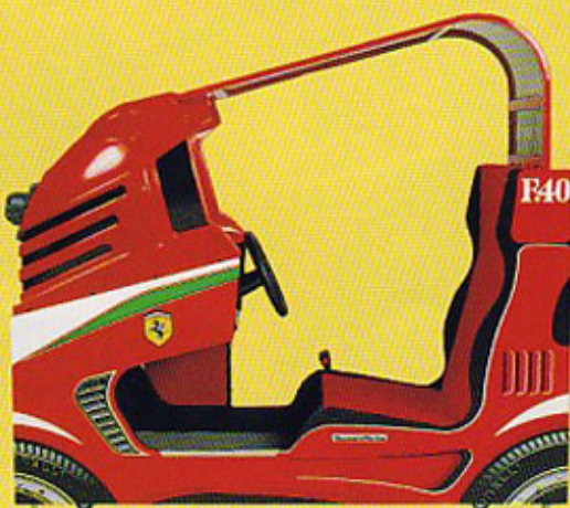
コックピットタイプ