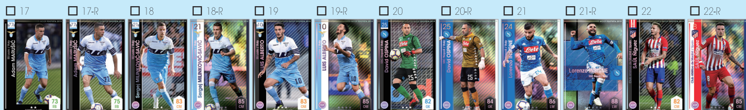
Adam MARUŠIĆ Sergej MILINKOVIĆ-SAVIĆ LUIS ALBERTO David OSPINA Lorenzo INSIGNE SAÚL Ñíguez