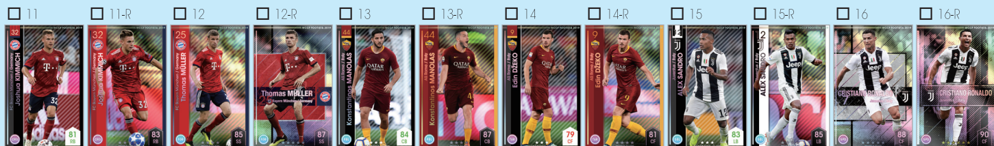
Joshua KIMMICH Thomas MÜLLER Konstantinos MANOLAS Edin DŽEKO ALEX SANDRO CRISTIANO RONALDO