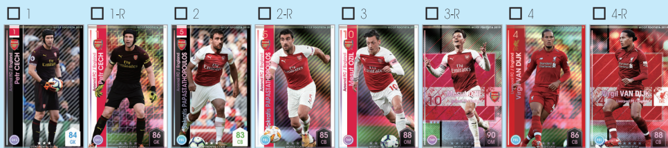
Petr CEC H Sokratis PAPA STATHOPOULOS Mesut OZIL Virgil VAN DIJK