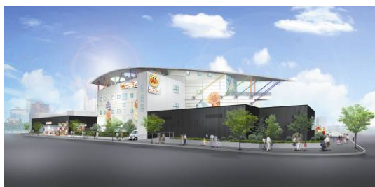
▲完成予想パース図