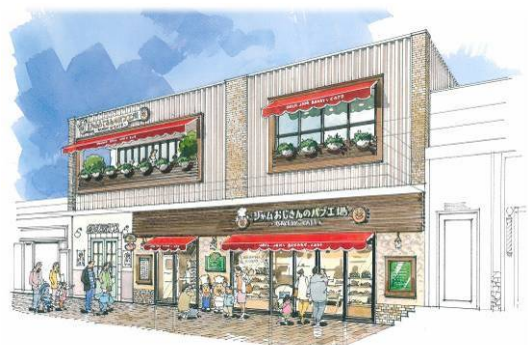
▲外観 完成予想パース図