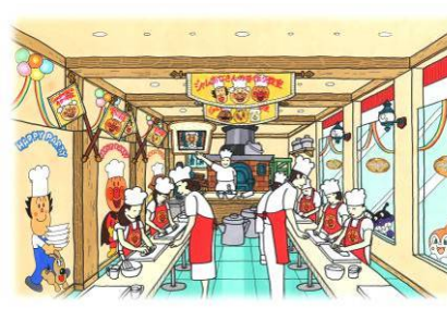
▲2F (パン教室) イメージ