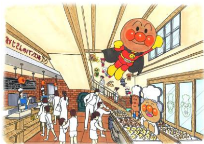
▲1F (ベーカリーショップ) イメージ