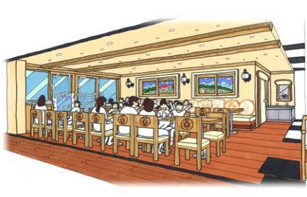
▲2F (イートインカフェ) イメージ