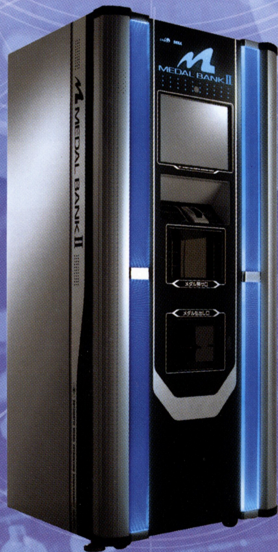
MEDAL BANK II