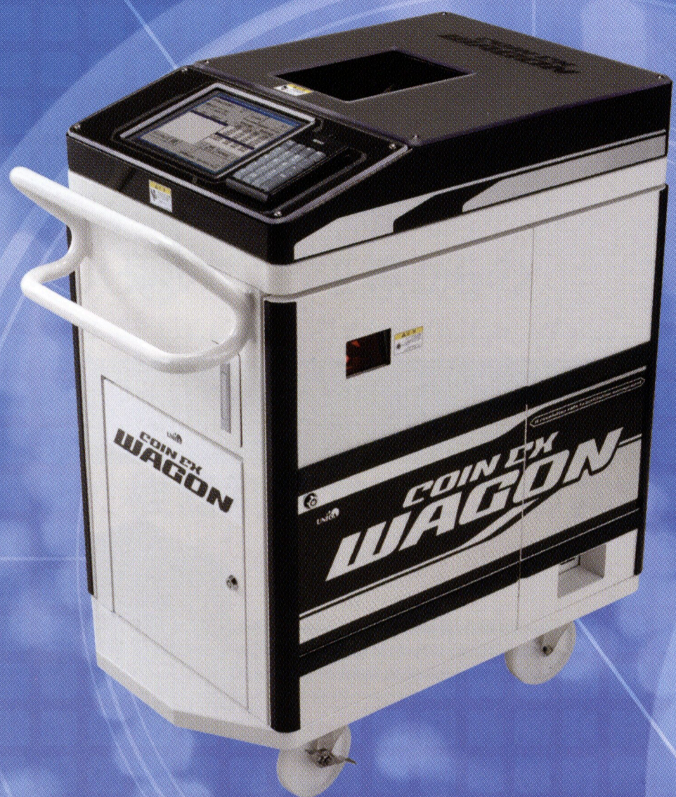
COIN EX WAGON