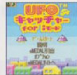
※コンテンツの一例