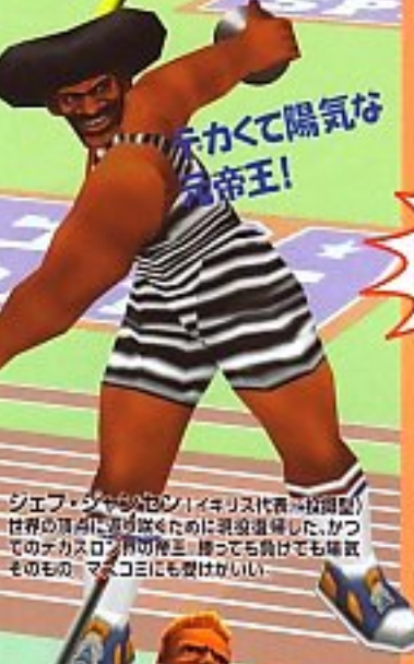
ジェフ・サビン (イギリス代表/短距離型) 世界の頂点に目指すために涙を流した。かつてのデカスロン界の神主。勝つても負けても確執そのもの。マスコミにも愛されていない。