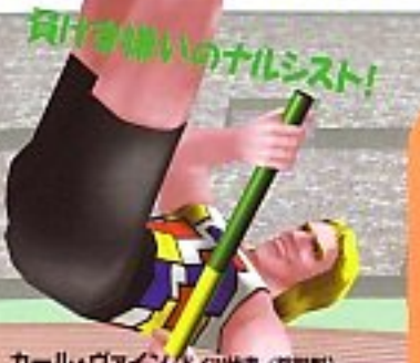
カール・ヴァイン (ドイツ代表/鉄餅型) キザな台詞とハードなアクション。観客に注目されていないと気が済まないというプライドの高さ。ヨーロッパで絶大な人気を持っている。

●高精細な3D-CGの鮮やかな映像でダイナミックなカメラワークを再現。●記録更新やファール判定のリプレイは、TV中継とながら! ●アーケード版の完全移植はもちろん、実際の種目順に行う「10種競技モード」や「練習モード」が楽しめる。