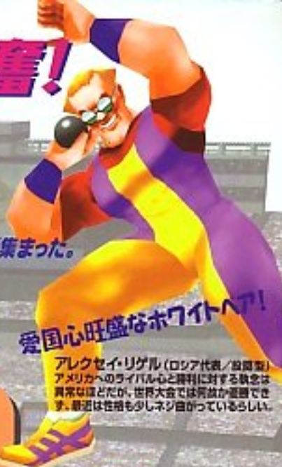
アレクセイ・リグル (ロシア代表/投擲型) アメリカへのライバル心と勝利に対する執念は異常なほどだが、世界大会では開放が運命でできず。最近では性格も少しネジ回っているらしい。