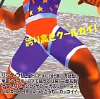
リック・ライト (アメリカ代表/万能型) 無敵の才能と自信で自らを第一選手と目立てる。その自信とプライドが、デカスリート・ライオンには見事なライオンと見られる。カッコイイ。