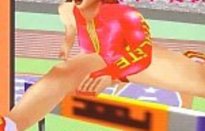
エレン・レジャーニ (フランス代表/競争型) 派手なメイクとコスチューム。色っぽいポーズで観客を魅了。その反面、ときどきヒステリックになったり。子供っぽさが見えたりする。