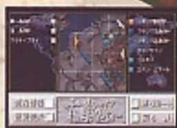
B: 実際にどんな戦闘が行われたのかわかる作戦画面。