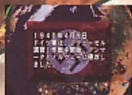
A: ゲーム中に歴史の流れを説明してくれるぞ。

歴史シミュレーションゲームのベストセラー作品「アドバンスド大戦略」が、グッとリアルに、スリリングになって、セガサターンに登場。アメリカ合衆国、ドイツ帝国、大日本帝国の中から選んだ国の作戦司令官となり、第2次世界大戦の歴史に添って戦いを繰り広げる。ミッドウェー、ガダルカナル、ノルマンディーといった歴史的に有名な戦場が次々登場。しかも3国それぞれに用意されたマルチシナリオ/プレイヤーの戦術しだいで、歴史にはない新たな展開もある。戦いの行く末はキミの腕にかかっているのだ。