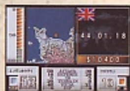
C: 大幅に改善された敵の思考時間は、最長でも約5分の驚異的な短かさ。