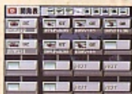
D: 進化・改良の形態も表型式で一目でわかる。