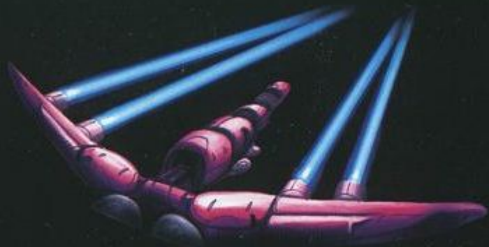
レーザートラップ