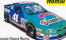
Scorpio Plasma Racing Max Speed: 333km/h [208mph]