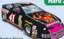
Phantom Racing Max Speed: 335km/h [208mph]

派手なボディカラーに身を包み、エンジン音を轟かせ、オーバルサーキットのバンクをアクセルを踏めるだけ踏み込み、極限を超えたスピードで駆け抜ける。スリップストリームを使いながらドリフトを決め、時にはガッツンと火花を放つ程に激突しながらのエキサイトティングな接近戦に、ギャラリー連もヒートする。