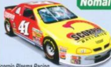
Scorpio Plasma Racing Max Speed: 330km/h [206mph]