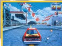
上級 / Advanced