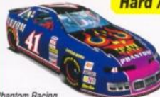
Phantom Racing Max Speed: 340km/h [212mph]