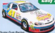
Chums Gum Racing Max Speed: 323km/h [201mph]