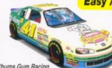
Chums Gum Racing Max Speed: 327km/h [204mph]