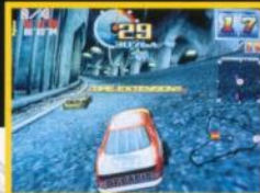
中級 / Intermediate

• Nagoshi Toshihiro, the leading producer of the first version Daytona USA , has applied his esteemed experience and knowledge in the production of Daytona USA 2 . Through calculations of fire engineering and physics of motion and power, he has created a very accurate simulation of the renowned 4-wheeled vehicles.