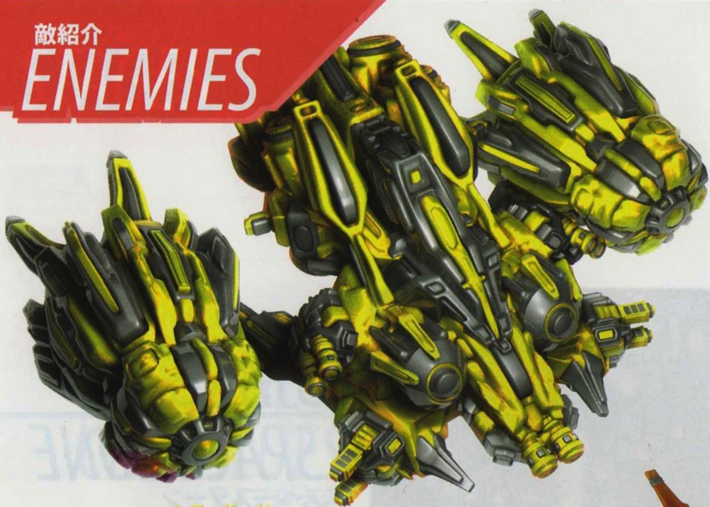
シティガード CITY GUARD