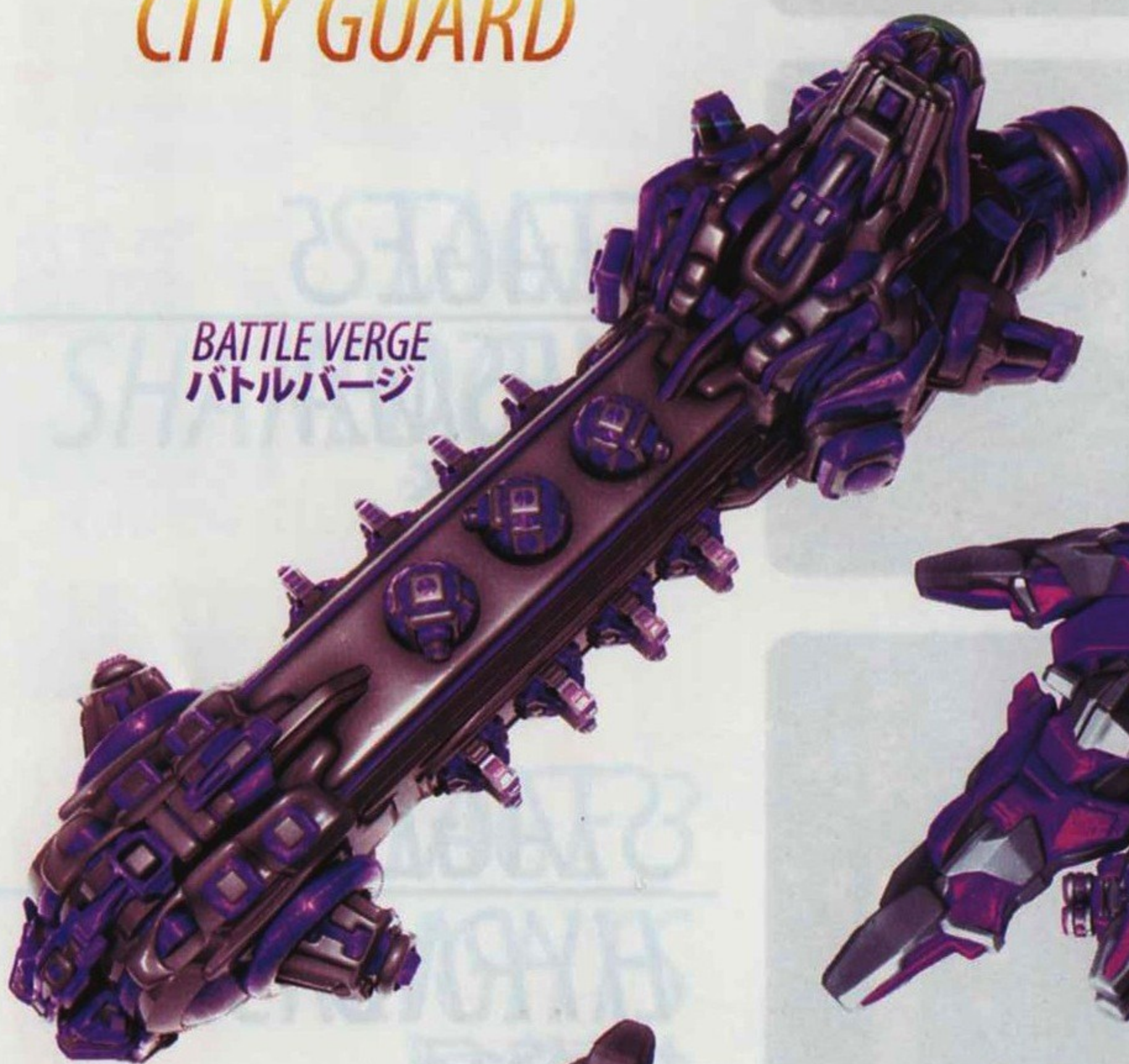
BATTLE VERGE バトルバージ