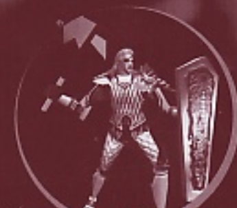
フェルディナント