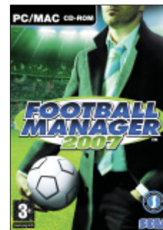
「Football Manager 2007」

© Sports Interactive Limited 2006. Published by SEGA Publishing Europe Limited. Developed by Sports Interactive Limited. SEGA and SEGA logo are either registered trademarks or trademarks of SEGA Corporation. Football Manager, Sports Interactive and the Sports Interactive Logos are either registered trademarks or trademarks of Sports Interactive. All other company names, brand names and logos are property of their respective owners.