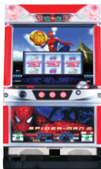
パチスロ遊技機「スパイダーマン2」