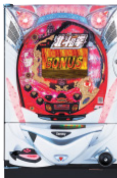
パチンコ遊技機「CR北斗の拳STV」