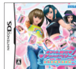
「オシャレ魔女 ラブ and ベリー ~DSコレクション~」