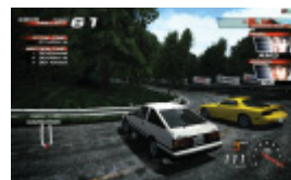
頭文字D ARCADE STAGE 4