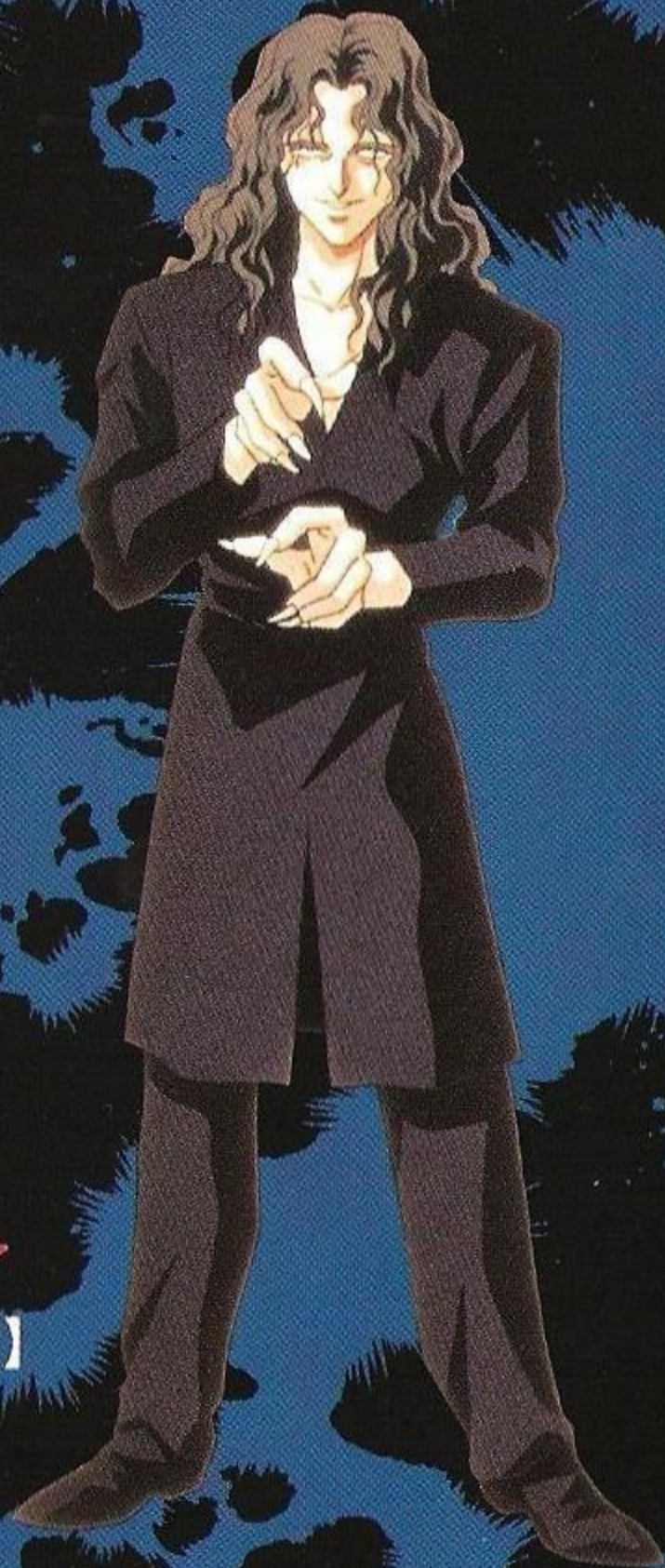
戸愚呂(兄) 【とぐろ(あに)】