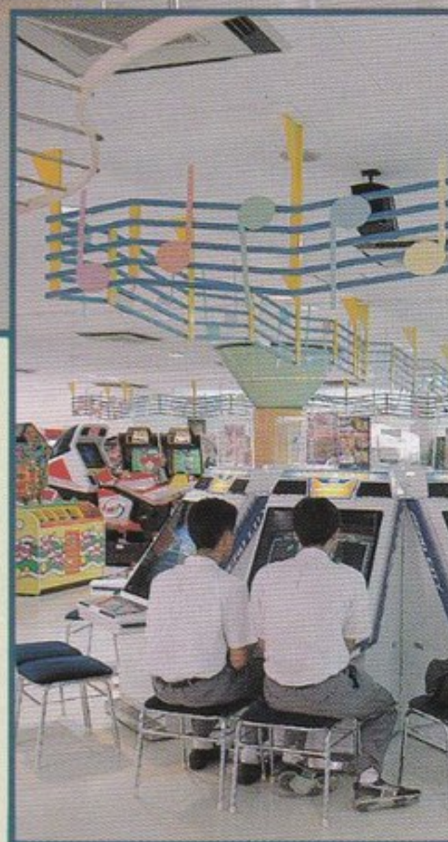
●オーツパークセガワールド