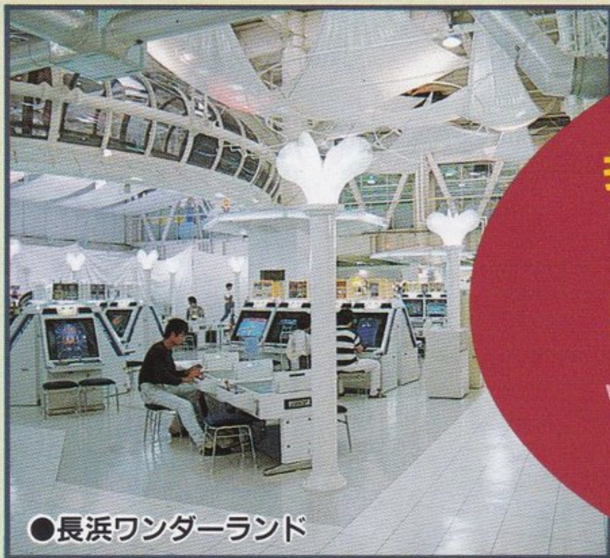
●長浜ワンダーランド