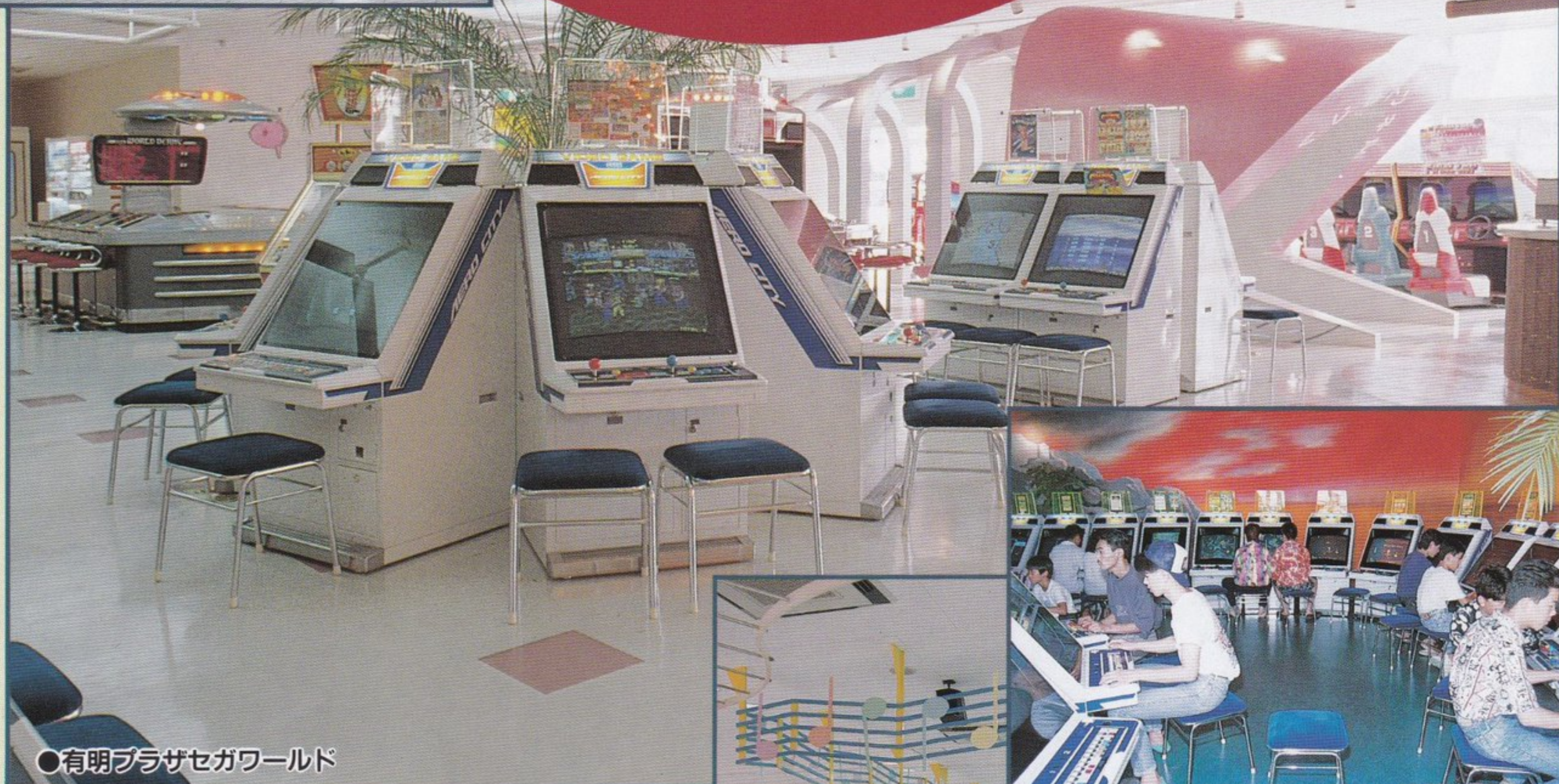
●有明プラザセガワールド

新規開店に、リニューアルオープンに、エアロシティ ／エアロテーブルを導入する店舗が急増中。明るい アミューズメント・スペースで、活性化、集客能力アップに 貢献します。