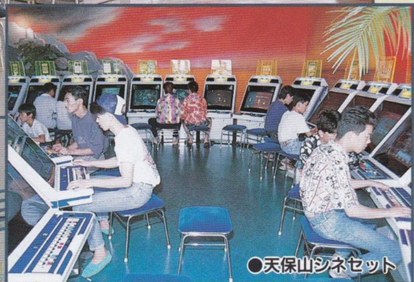
●天保山シネセット

More and more leisure businesses are introducing the AERO CITY / AERO TABLE for their openings and reopenings. These contribute to drawing in new customers and building an active and cheerful atmosphere in your amusement center.