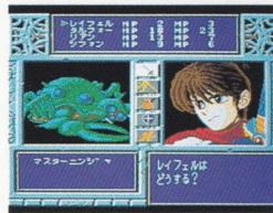
精霊神世紀フェイエリア