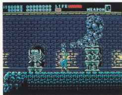
アーネスト・エバンス