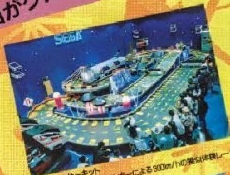
●スーパーサーキット ビデオカメラ搭載のラジコンカーによる300km/hの類似体験レース