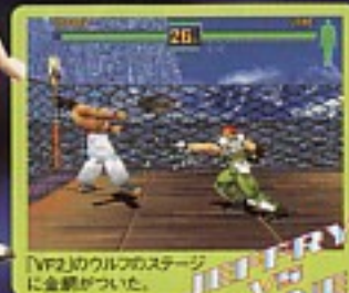
LAU VS JEFFRY 「VF2」のウルフのステージに金網がついた。

バイバースでお馴染みの金網に囲まれたステージ、壁もリングもないステージなど、このゲームのために新たに作られたステージが登場!