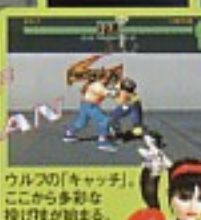
WOLF VS SANMAN ウルフの「キャッチ」。ここから多彩な投げ技が始まる。