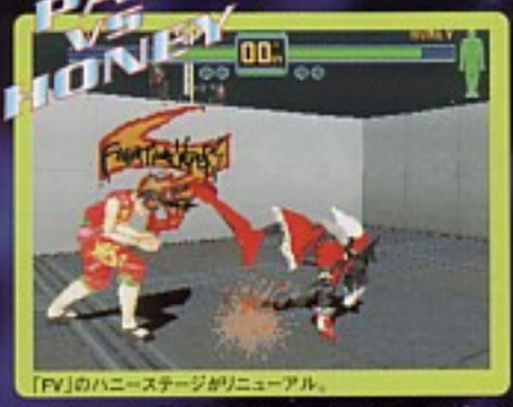
PAI VS HONEY 「FV」のハニーステージがリニューアル。

バイバースでお馴染みの金網に囲まれたステージ、壁もリングもないステージなど、このゲームのために新たに作られたステージが登場!