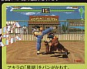
AKIRA VS BAHN アクラの「昇龍」をパンがかわす。

「バーチャファイター」のキャラクターの中には、「バーチャファイター3」で登場した新技を使うファイターもいる。対する「バイバース」は、それぞれが新技をマスターして登場する!