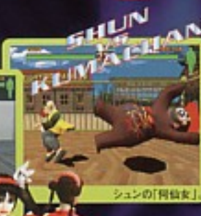
SHUN VS KUMACHAN シュンの「何処女」。