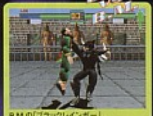
B.M. VS KUMACHAN B.M.の「ブラックレインボー」。