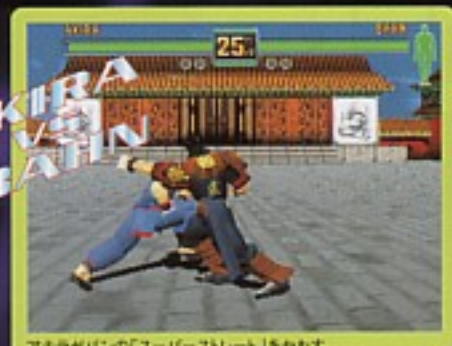
AKIRA VS BAHN アクラがバンの「スーパーストレート」をかかわす。

「バイバース」の専売特許であった空中での「受け身」。「バーチャファイター3」で登場する「かわし」を全キャラクターがマスター。さらにハイパーな闘いが繰り広げられる!