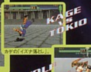
KAGE VS TOKIO カゲの「イスナ落とし」。