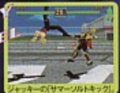
JACKY VS RAXEL ジャッキーの「サマーンバトキック」。