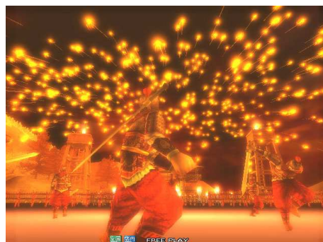
戦局を一変させる強力な火計