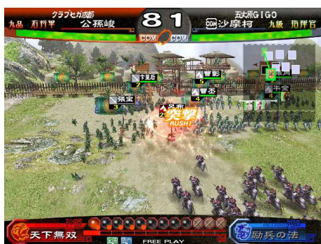
カードを動かすだけで、戦いが始まる