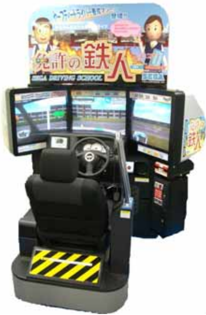
(「免許の鉄人」ゲーム画面)