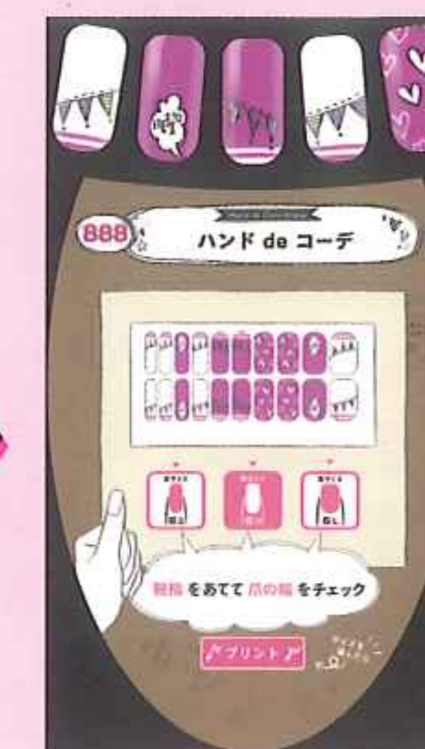
その場ですぐにプリントアウト!