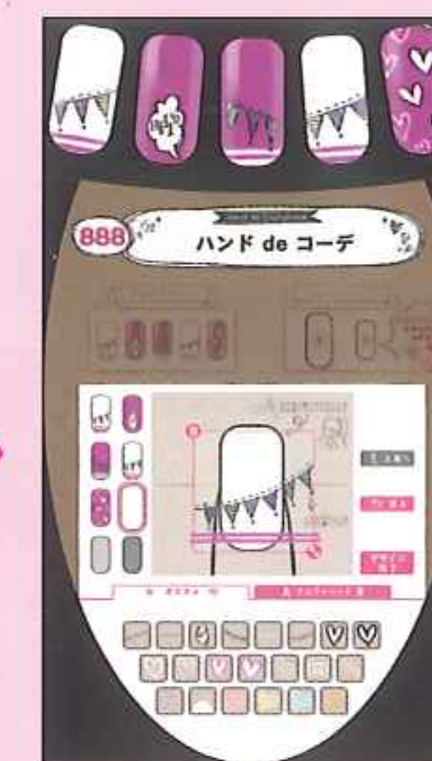
自由にカスタマイズ!