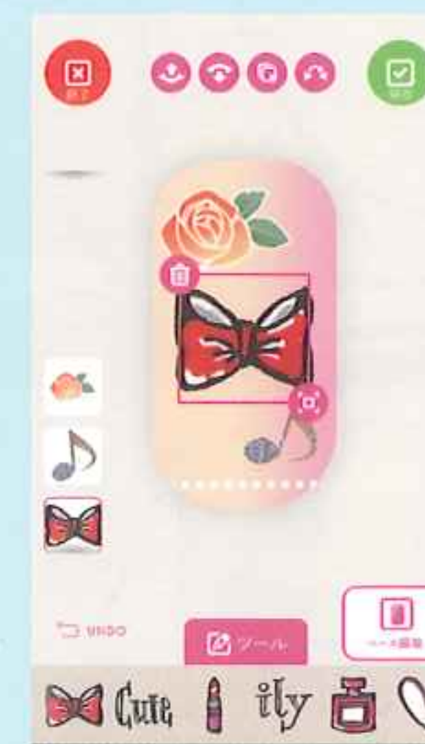
スマホアプリで自由にデザイン!