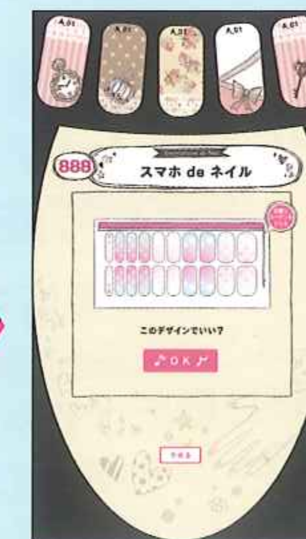
自分だけのネイルシールをプリントアウト!