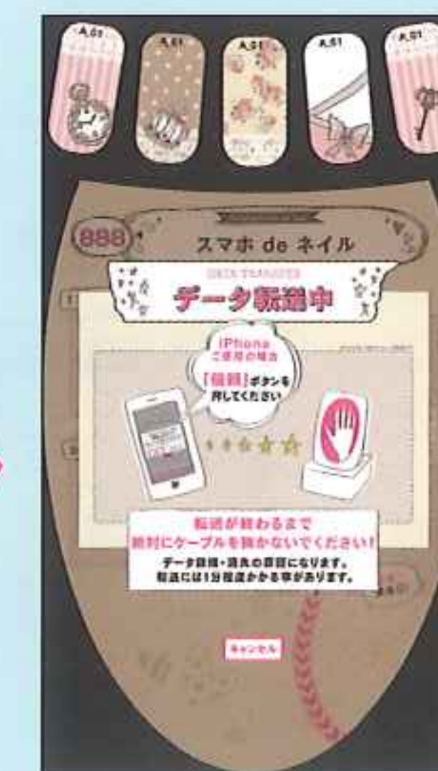
お店に行きデザインデータを読み込む