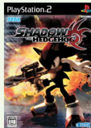
「Shadow The Hedgehog」