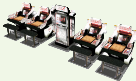
リアルタイムカードバトルゲーム「三国志大戦」

以上の結果、売上高は715億12百万円(前期比13.0%の増)、営業利益は121億76百万円(前期比64.0%の増)となりました。