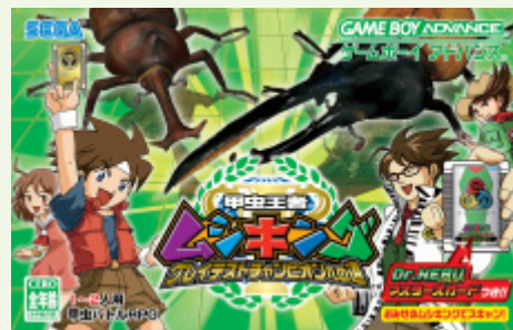
GBA向けゲームソフト 「甲虫王者ムシキング～グレイテストチャンピオンへの道～」

その他事業におきましては、主に商業施設等の企画・設計・監理・施工および業務用カラオケの販売等を行い、売上高は194億97百万円(前期比17.8%の減)、営業損失は17億12百万円(前期は、5億41百万円の損失)となりました。