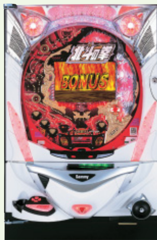
パチンコ遊技機「CR北斗の拳」 © 武論尊・原哲夫 / NSP 1983 © Sammy