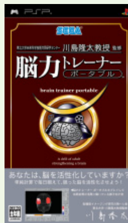
PSP向けゲームソフト 「東北大学未来科学技術共同 研究センター川島隆太教授監修 脳力トレーナー ポータブル」