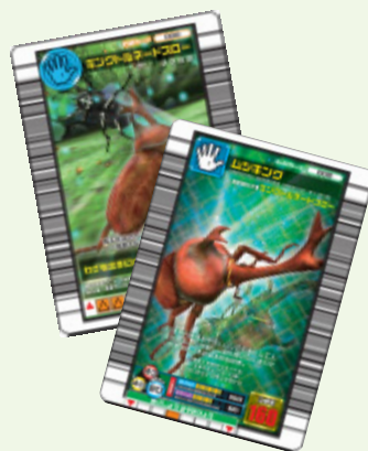
「甲虫王者ムシキング」

以上の結果、売上高は1,062億45百万円(前期比27.7%の増)、営業利益は92億44百万円(前期比68.9%の増)となりました。