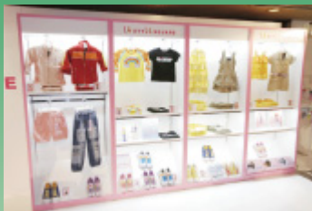
「オシャレ魔女 ラブ and ベリー」 オフィシャルショップ「LB Style Square」

セガは、女の子の絶大な支持を集めている業務用キッズ向けカードゲーム『オシャレ魔女 ラブ and ベリー』のオフィシャルショップ『LB Style Square』の全国展開を開始しました。