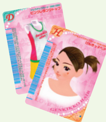
「オシャレ魔女 ラブ and ベリー」