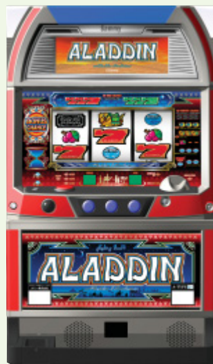
パチスロ遊技機「アラジン2 エボリューション」 © Sammy

以上の結果、売上高は2,656億31百万円(前期比5.2%の減)、営業利益は998億47百万円(前期比3.9%の減)となりました。