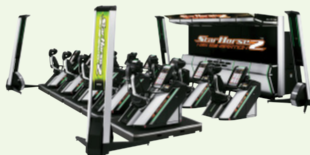
「スターホース2 ニュージェネレーション」